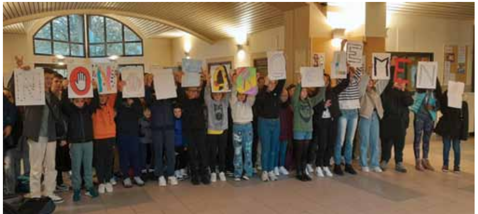
Une fresque « Non au harcèlement » a été proposée à l'ensemble du collège par les élèves ambassadeurs.

En 5 ème , les jeunes scientifiques vont s'investir avec la fondation Tara aux côtés de chercheurs et réaliser des prélèvements sur les rives du Rhône en vue d'analyses. Les objectifs étant de mettre en œuvre une démarche scientifique et