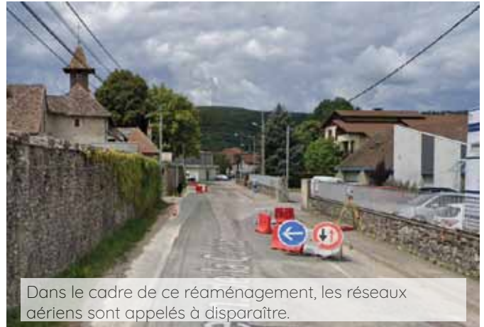
Dans le cadre de ce réaménagement, les réseaux aériens sont appelés à disparaître.

lectif) afin d'éviter, in fine, le débordement des cours d'eau : en centre bourg, cela se traduit par la volonté de faciliter l'infiltration diffuse et plus naturelle des eaux pluviales dans les sols sans qu'elles soient conditionnées dans un seul et même réseau engendrant un débit important et immédiat en sortie ;