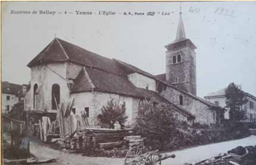
L'église de Yenne